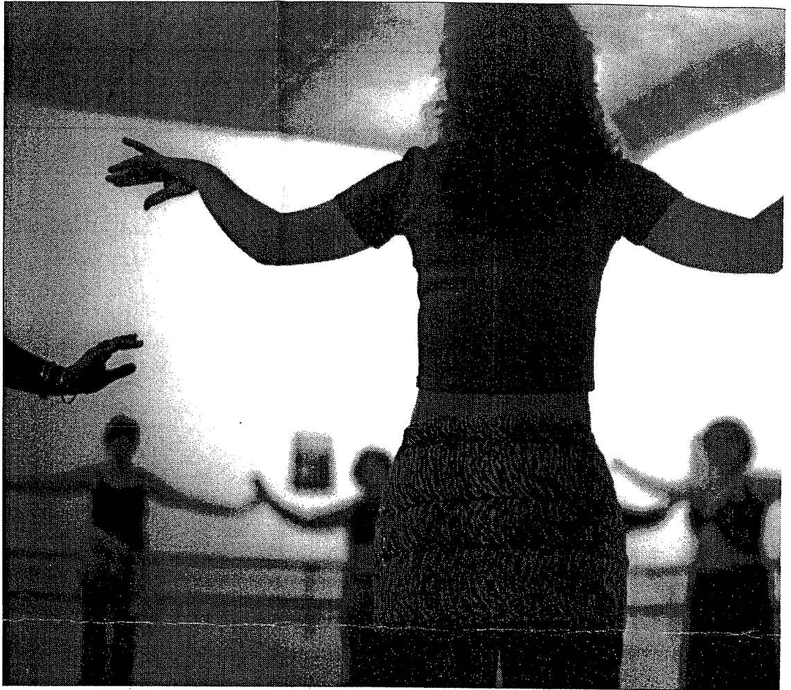
De juiste beweging voor buikdansen...

Maar voor de beginners is het toch behoorlijk zwaar. De kunst is de lichaamsdelen afzonderlijk van elkaar te bewegen. Daar is een behoorlijke spiercontrole voor nodig. Na de opwarmronde begint een oefening waarbij uitbundige heupvibraties aan de